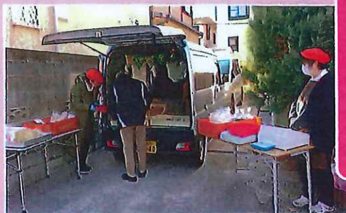
買物の不便な地域に移動販売車を招致する取り組みも始めています。

R5年12月より、上河内遊園地横の駐車場をお借りし、第2・4木11:30～12:00にホナベティが車でパンの販売をしています!※日時は変更になることがあります