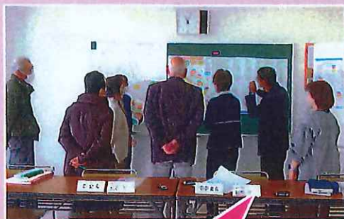
地域毎の課題抽出を話し合っている様子

R3年に地域の方向けに実施したアンケートから地域の課題を検討しました。様々な困りごとが挙がる中で、アンケートを実施した全ての地域において、買物に関する情報が欲しいという回答が多く見られました。このことから、今年は外出が難しくなった方に利用いただくことを想定した「買物情報リスト」を作成しました。部会員が上鶴間圏域の店舗に出向き、配送の有無や電話注文を行っているか等ヒアリングさせていただきました。お忙しい中ヒアリングにご協力いただき、どうもありがとうございました。