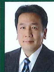
パネリスト 衆議院議員 枝野 幸男