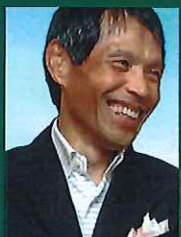
審査員・パネリスト 元参議院議員・弁護士 丸山 和也