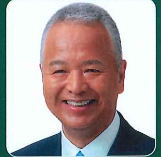
記念講演講師 甘利 明 元経済再生担当大臣

半導体戦略推進議員連盟会長、バッテリー等の基盤産業振興議員連盟会長、カーボンニュートラルのための国産バイオ・合成燃料を推進する議員連盟会長、ルール形成戦略議員連盟会長、日本フランス友好議員連盟会長(衆議院超党派)、日本イタリア友好議員連盟会長(超党派)、日本アゼルバイジャン友好議員連盟会長(超党派)、リサイクル推進議員連盟会長(超党派)、宇宙エネルギー利用推進議員連盟会長、知的財産制度に関する議員連盟会長、コンテンツ産業推進議員連盟会長、音楽文化振興議員懇談会会長 他